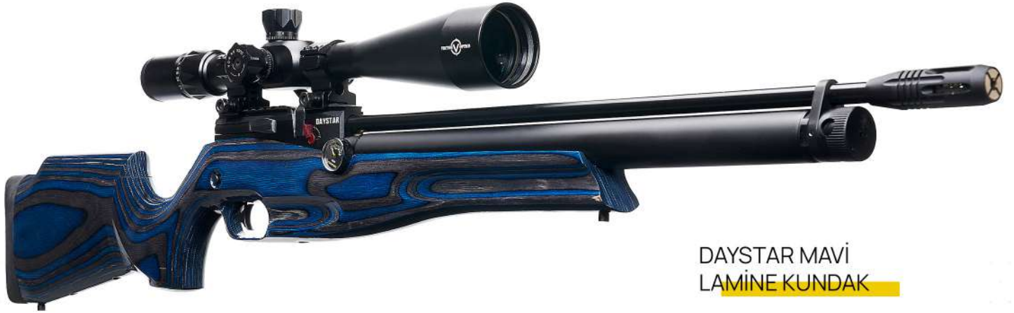
DAYSTAR MAVİ LAMİNE KUNDAK