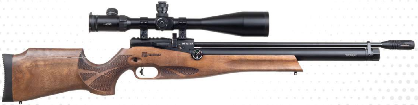
DAYSTAR W AHŞAP