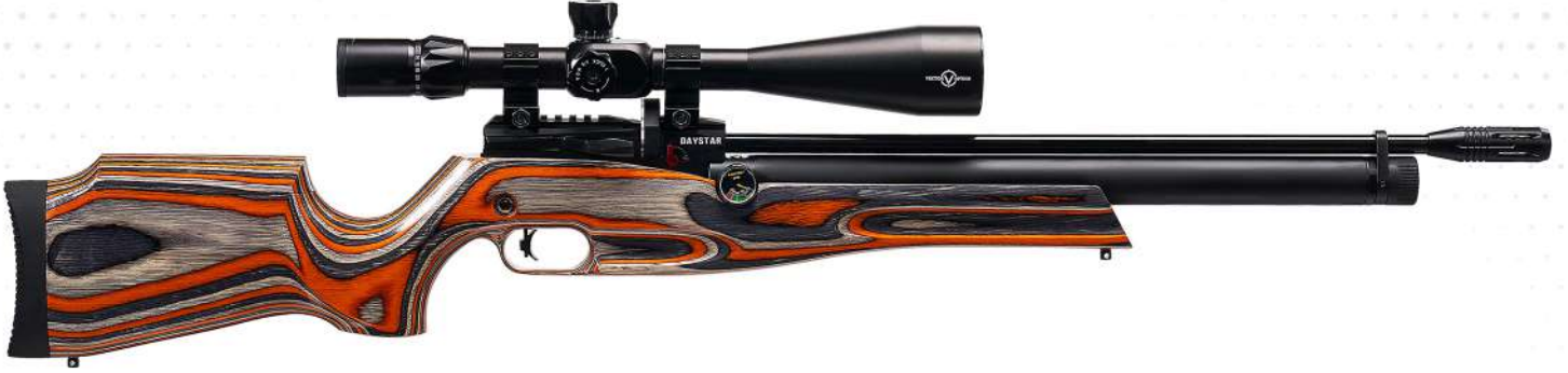
DAYSTAR TURUNCU LAMİNE KUNDAK