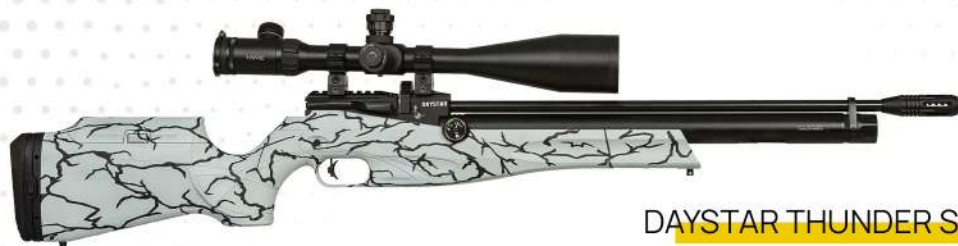
DAYSTAR THUNDER SNOW