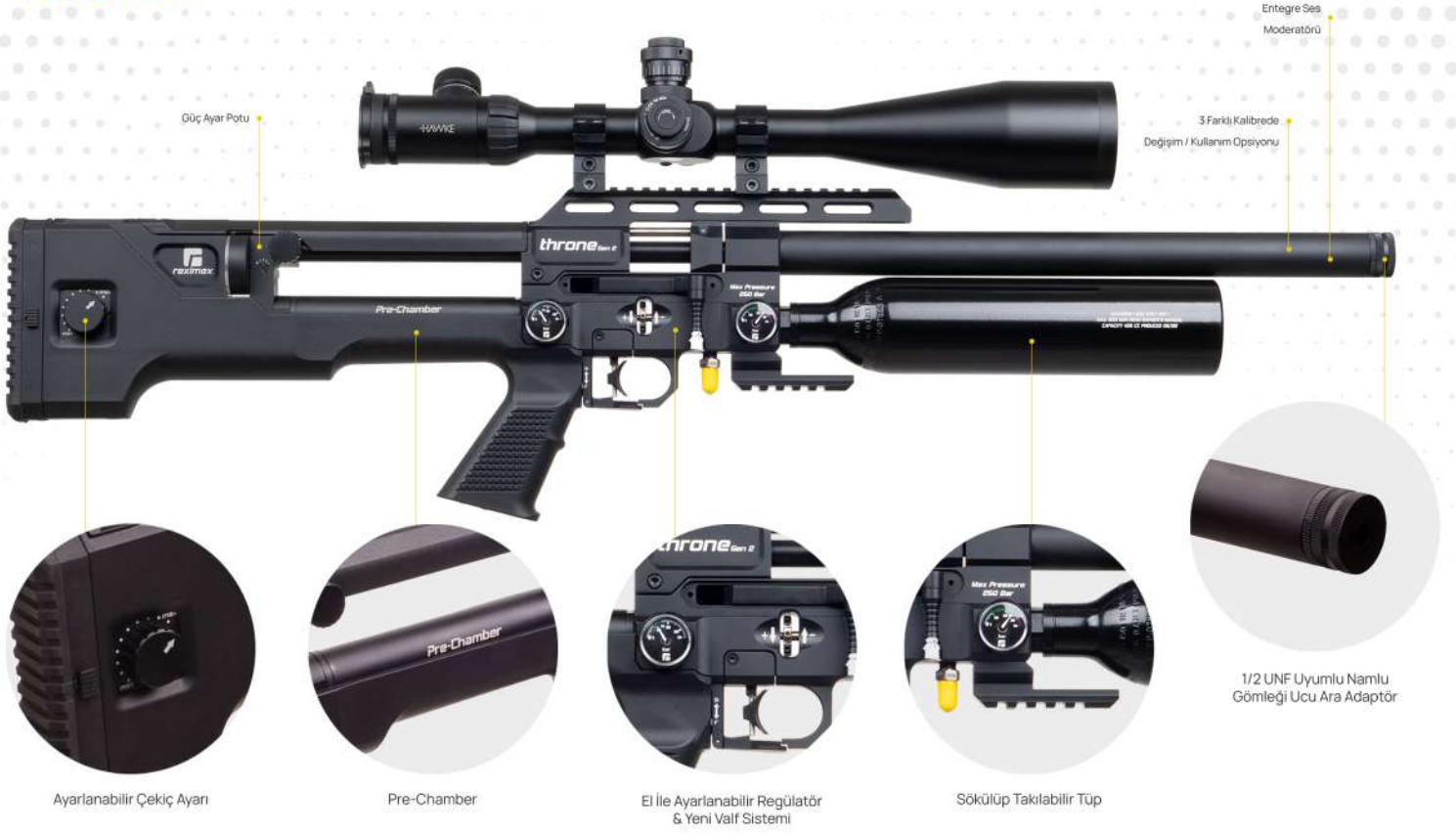
Ayarlanabilir Çekiş Ayarı