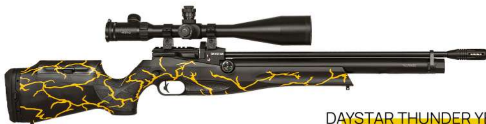
DAYSTAR THUNDER YELLOW