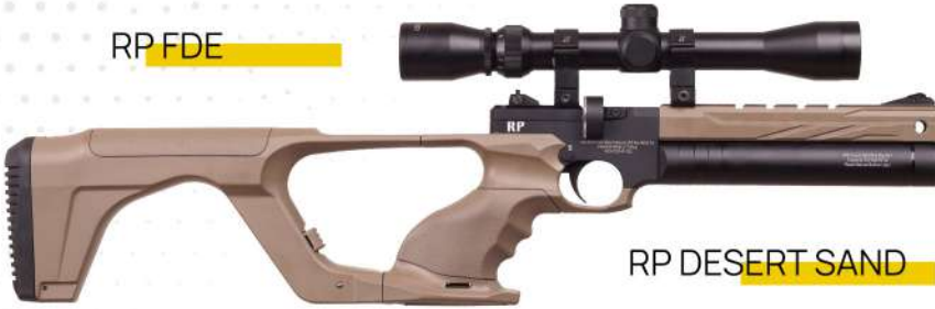
RP DESERT SAND