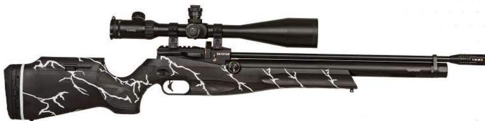
DAYSTAR THUNDER WHITE